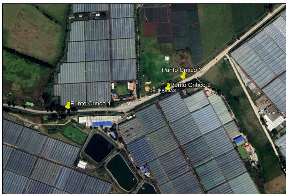
Ilustración 1. Puntos de limpieza

Con la finalidad de recuperar la limpieza el orden y evitar vectores relacionados con la acumulación de residuos y dar cumplimiento a lo establecido en el Artículo 46 del Decreto 2981 de 2013 el cual menciona ... "Censo de puntos críticos. Las personas prestadoras del servicio público de aseo en las actividades de recolección y transporte en su área de prestación harán censos de puntos críticos, realizarán operativos de limpieza y remitirán la información a la entidad territorial y la autoridad de policía para efectos de lo previsto en la normatividad vigente. El municipio o distrito deberá coordinar con las personas prestadoras del servicio público de aseo o con terceros la ejecución de estas actividades y pactar libremente la remuneración." ..., el día 08 de agosto de 2025 se realizó la limpieza en los puntos críticos ubicados en la vereda El Cocli (Ver ilustración 1 y 2).