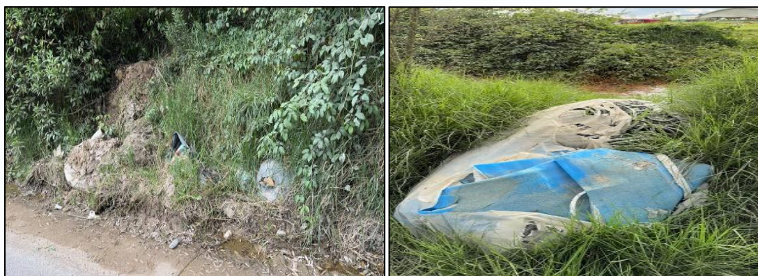
Ilustración 2. Evidencia Puntos Críticos