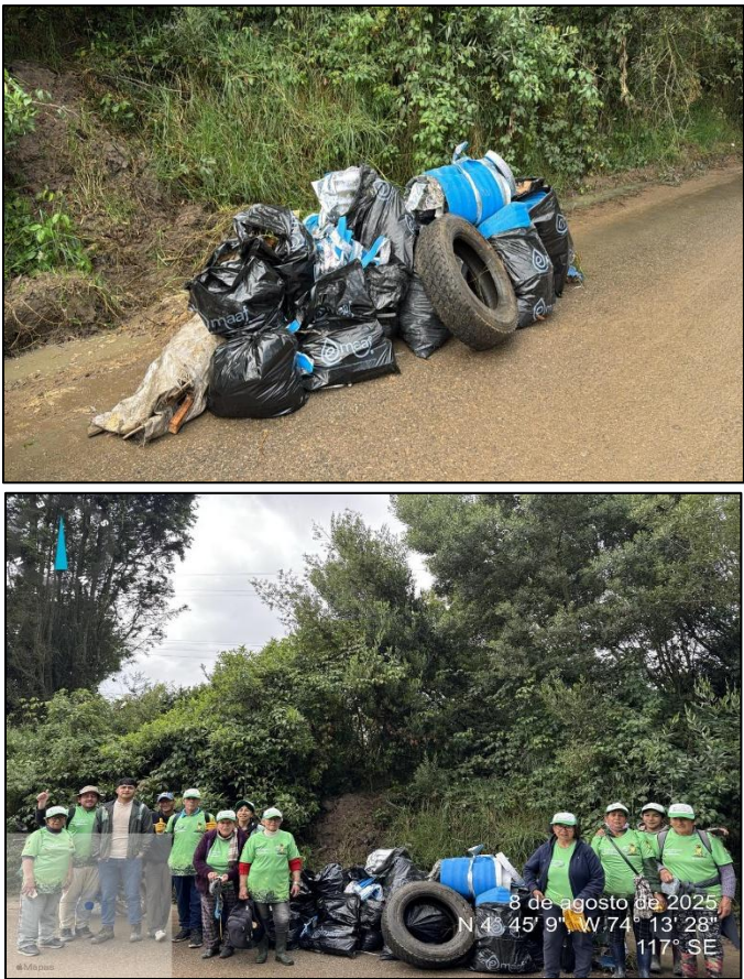
Ilustración 4. Recolección EMAAF

Una vez finalizado lo anterior, se dispuso los residuos en un punto específico con la finalidad de facilitar la recolección la cual fue realizada por la Empresa de Acueducto, Alcantarillado y Aseo de Funza – EMAAF SAS ESP (ver ilustración 4).