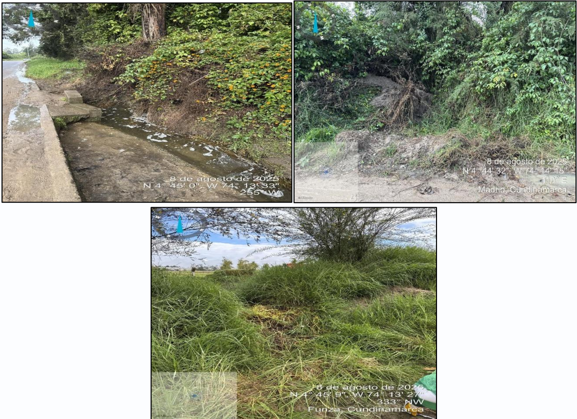
Ilustración 5 – Puntos Recuperados

Finalmente, se recolectaron un aproximado de 220 Kg (kilogramos) residuos y se reportan los puntos como recuperados. (Ver ilustración 5)