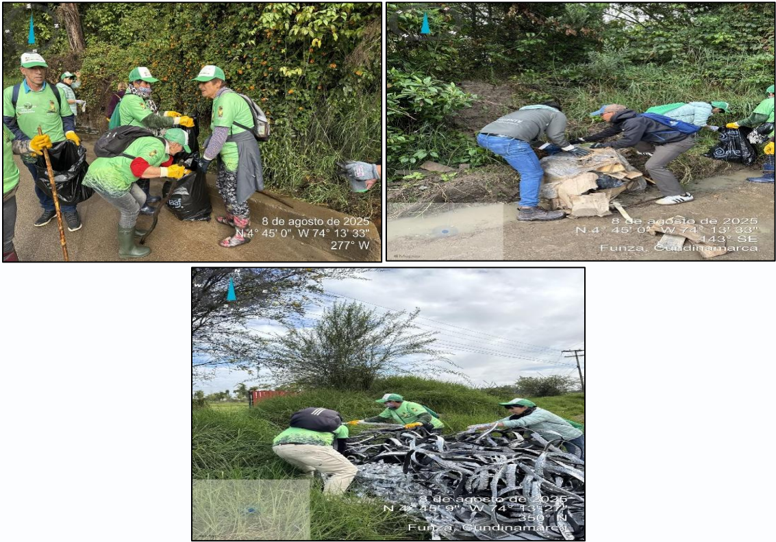
Ilustración 3. Limpieza Puntos Críticos 1,2 y 3.

Durante la jornada, el personal de la Secretaría de Ambiente y Bienestar Animal de Funza en compañía de los Guardianes por el Ambiente llevo a cabo el levantamiento de los residuos arrojados de forma clandestina, dando formación a puntos críticos de acumulación de residuos.